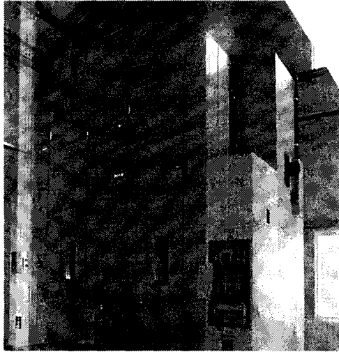
그림 4. 열관류율 측정기기